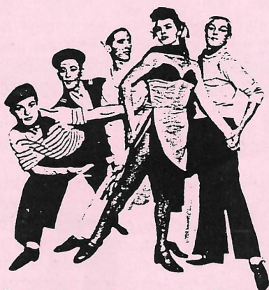
La chorale A Travers Chant vue par son chef