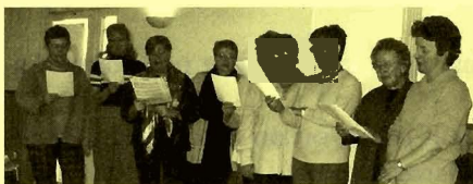
Le chœur des chefs de chœur