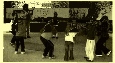
Les enfants aussi étaient de la fête