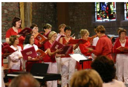
Les Dames de Chœurs à Gérardmer