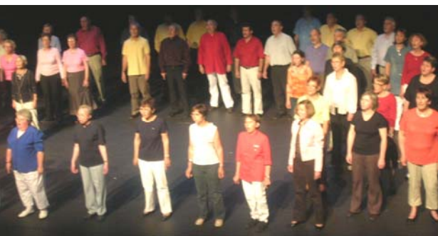
Les choristes ACJ du Barrois en mouvement

Et puis nous nous sommes résignés à nous limiter raisonnablement à dix chants pour une question de temps de travail. Nous avons assuré de notre côté la mise en place et la mémorisation des chants préalablement d'Etienne. Hormis une demi-journée de