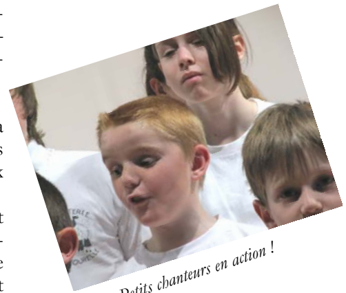
Petits chanteurs en action !