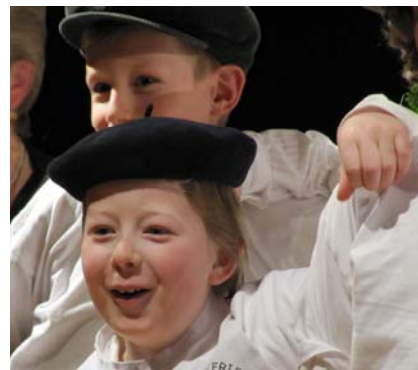
Merveilleux moment de fraîcheur avec les enfants

Le 9 octobre prochain l'AG Régionale se tiendra à Bar le Duc. Ce sera le moment d'élire les nouveaux représentants à l'AG Nationale (7 élus parmi les chefs de chœur et les choristes élus pour deux ans). N'hésitez pas à participer à la réflexion engagée, présentez votre candidature pour retrouver tous les élus des régions à Dijon en mars 2011