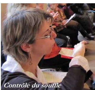
Contrôle du souffle

Quel que soit le niveau d'une chorale, la justesse est une préoccupation constante pour le chef... et les choristes qui se respectent ! Encore faut-il pouvoir cerner les origines – parfois fort complexes – de ce problème, et surtout tenter de trouver des « trucs » efficaces pour y remédier. Qui d'entre nous ne s'est jamais demandé, avec plus ou moins d'agacement ou d'angoisse (selon les tempéraments) : « Mais comment améliorer la justesse du chœur ? »