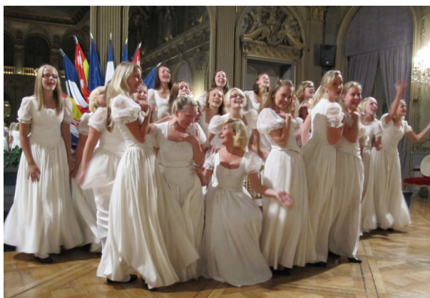
I feel pretty ...