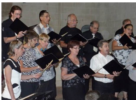
La Cantalud' à Rasteau