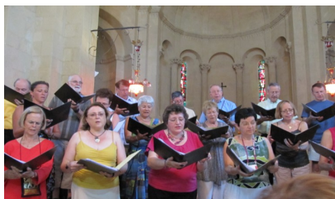
Ars Musica répète à St Quenin

Dans le cadre des concerts programmés aux Choralies Croqu'notes s'est produit au Gymnase et Ars Musica à St Quenin