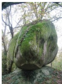
Le caillou de Trégunc

C'est la tête pleine de chansons et le cœur rempli de bons souvenirs que nous sommes repartis avec l'envie de recommencer l'an prochain .